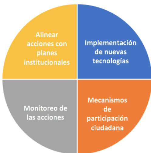
Principales sugerencias para capacitación

Dentro de las sugerencias presentadas por las organizaciones, se pueden seleccionar las cuatro que fueron más recurrentes, expresadas en la gráfica.